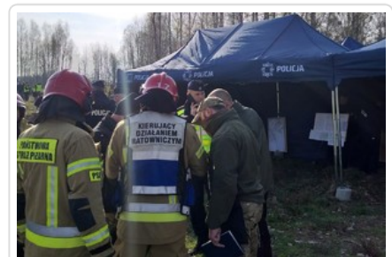
Miejsce działań dowództwa ćwiczeń