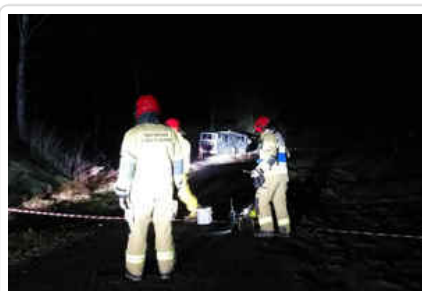
Oględziny miejsca zdarzenia