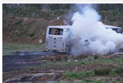
Neutralizacja niewybuchu przy autobusie