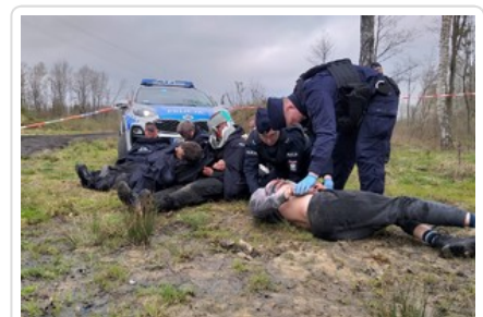
Policjanci udzielający pomocy rannym