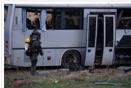
Uszkodzony autobus po wybuchu