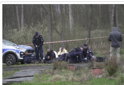
Policjanci udzielający pomocy rannym