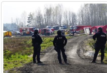
Policjanci na miejscu ćwiczeń